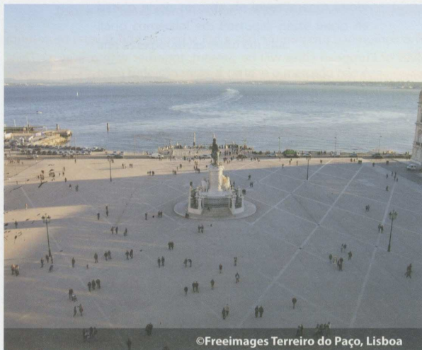
Terreiro do Paço, Lisboa