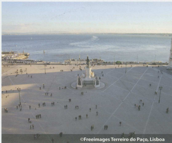
Terreiro do Paço, Lisboa