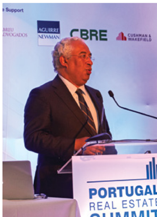
António Costa, Prime-Minister of Portugal

On September 20 and 21, Estoril was the meeting point for approximately 300 professionals in the national and international real estate industry, who came together for the Portugal Real Estate Summit.